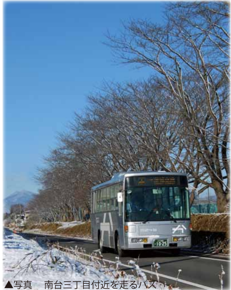
▲写真 南台三丁目付近を走るバス