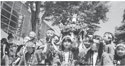
子ども神輿の闊歩