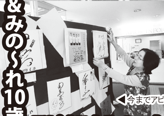
◀今までアピオスに来たアーティストのサイン展も開催!!