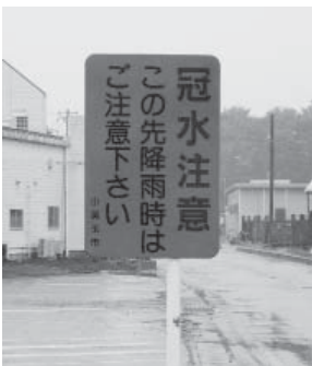
冠水注意の看板を設置 (部室地内)