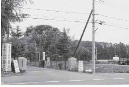
電柱の右側が確保された購入予定地 (小川北中学校正門付近)

A 現在の進入路の幅は約9m、木々に覆われているため狭くなっている。用地購入により幅員を約15mに拡幅し、歩道及び車道の整備を図っていく予定。