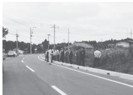
改良工事が終了した市道美2-11号線 (羽鳥脇山地内)

工事が終了し、供用開始になったので、2-11号線上と重複している571号線の一部の認定を廃止するもの。