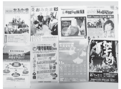
区長便回覧の広報紙

①市広報との同時配布物の基準は定めていない。現在、区長便回覧として発送する場合、市が主催・共催・後援、また、国・県からの配布物を含め公共性が高いものを過去の経緯等を参考に送付している。②市では各行政区等の自主性を鑑み、回覧における指針・ガイドラインは定めていない。③現在、広報規則は制定していない。しかし、広報は市民との協働を推進するうえで重要となることから規則に基づき広報紙を発行するのが肝要と考える。早急に広報規則を整備する。