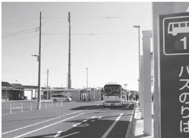
循環バス（旧小川駅 新バスターミナル）

土日・祝日の運行と、現在運行から外れている4地区運行ルートの再検討はされたのか。