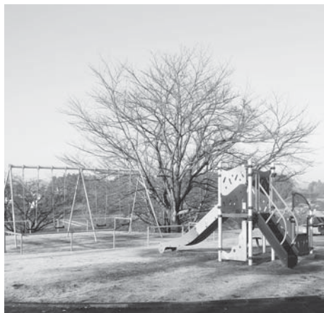
希望ヶ丘公園に新設された遊具

Q 低所得者でも払える国民健康保険税にして短期被保険者証の発行減少施策を図って欲しい。