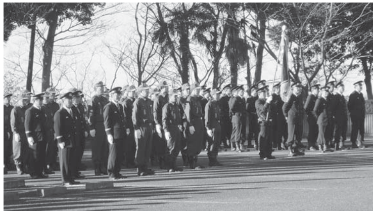
防災意識 新たに！消防出初式（生涯学習センター コスモス）

を実施していく。装備については、団員の安全確保を図るため、装備の充実強化に計画的に取り組み、円滑な消防団活動が実施できる環境づくりに努めていく。