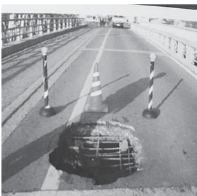
道路抜け落ち事例、目に見えない内部の劣化

また、要望のあるこの調査については、現在市内で国土交通省の補助を受け実施しているストック総点検調査の結果によりその実施の有無を判断したい。