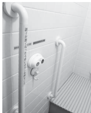
手すりがつけられて（風呂場）

今後は高齢者の自立した生活を支援するために、全庁的かつ横断的に検討をしていきたい。