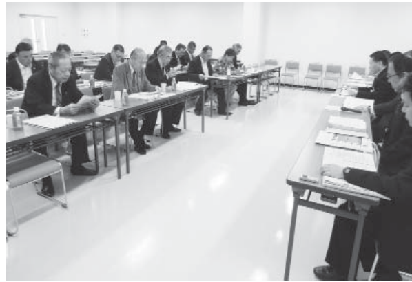
成田富里いずみ清掃工場研修室にて

か、発電設備で熱回収を行っている。焼却とは違う処理方式の施設を視察し、見識を広げることができた。