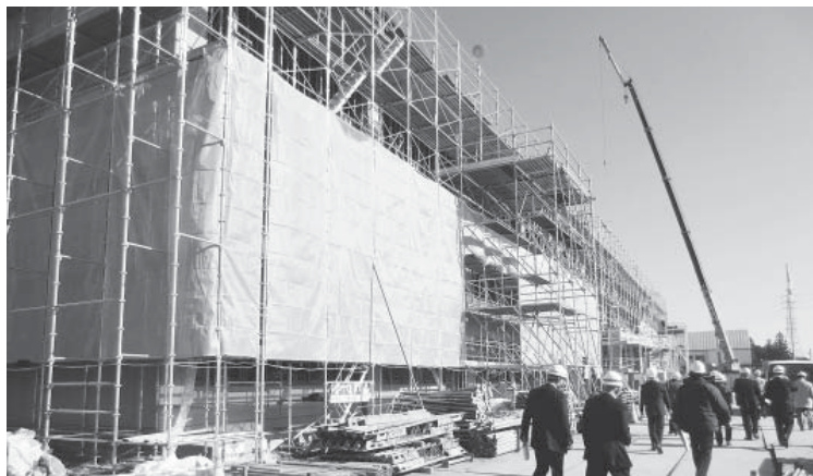
3階建ての校舎完成が間近（竹原小学校）