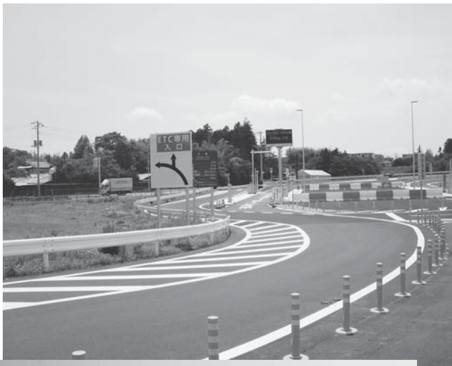
▶石岡小美玉スマートインター

沿道の利用、地域住民の住環境さらにはそれぞれの都市の整備の必要性もあるので、関係部署との協議も十分していく。また、少子化対策、人口減少の話でもあるので、こういうものを起爆剤にして総合計画に基づいてまちづくりを推進する。