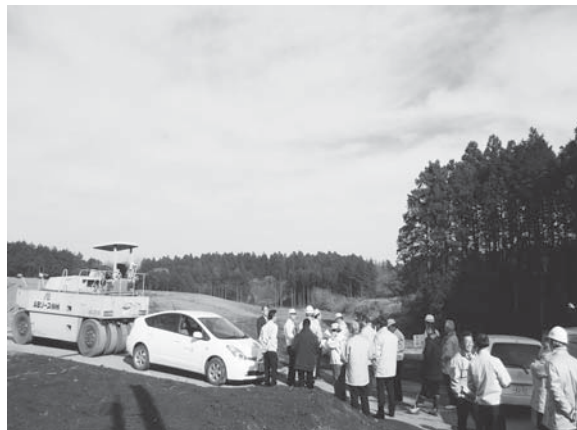
宮田防災公園の現地調査（産業建設常任委員会）