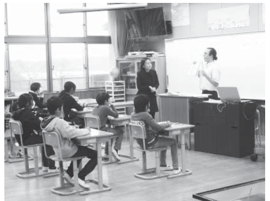
下吉影小学校の授業風景