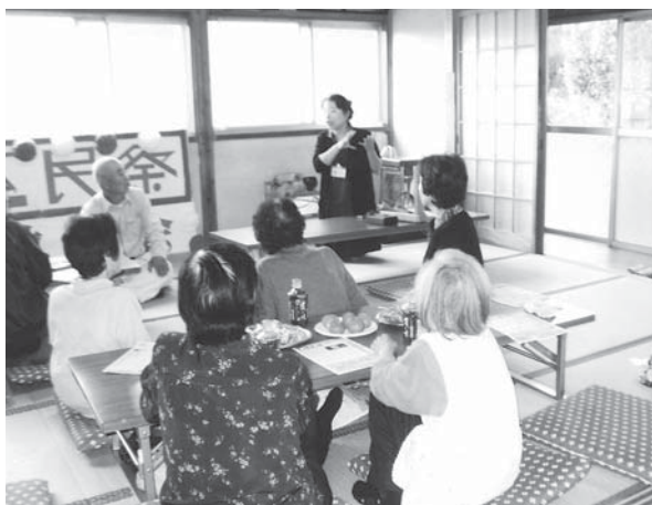
健康づくり相談教室（花野井老人クラブ）

Q 第6期介護保険事業計画の中で、認知症の方の家族に対する支援、給付費等の予算化は