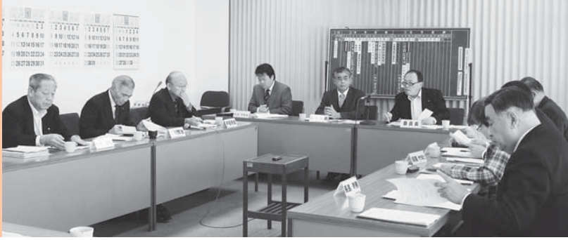
議員提案条例等調査特別委員会

小美玉市議会では、更なる議会の活性化を図るため、議会基本条例の素案をまとめました。この素案は、約2年間にわたる議員提案条例等調査特別委員会と全員協議会での調査・検討をとおして策定したものです。