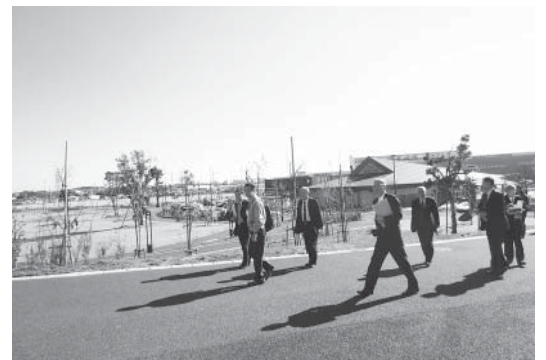
上総更級防災公園を見学

②上総更級(かずささらしな)防災公園の概要と見学(千葉県原市) 防災機能を備えた市原市総合公園(愛称「上総更級公園」)は、平成25年4月に供用開始され、9.9haの敷地には、防災井戸、防災備蓄倉庫、井戸ポンプ、防災四阿(あずまや)、ソーラーLED照明、かまどベンチ、トイレベンチ、LEDブロック(ソーラー)などが設置されている。また、公園に隣接して医療・救護活動拠点となる総合病院や避難所として活用できる勤労会館、防災用水源となる修景池、復旧部隊ベースキャンプとなる芝生公園等があり、有事に備える万全の施設となっている。