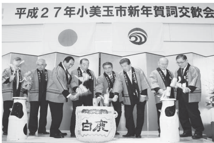
乳製品（飲むヨーグルト）の普及を図って乾杯！

A 条例第5条に嗜好等への配慮ということで、強制するものではなく、あくまで特産品の普及拡大を図るため乳製品で乾杯をお願いするもの。