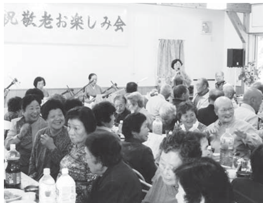
各地区で敬老会事業を展開(外之内区)