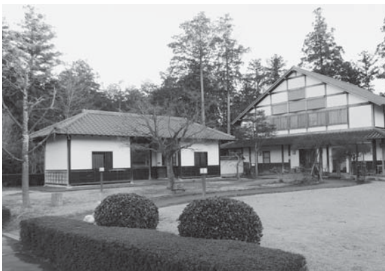
やすらぎの里小川

⑤国有地と民有地を借り受けているが、国有地は地価調査により見直しがあり、払い下げも検討中。民地は借り上げ解消に努めたい。