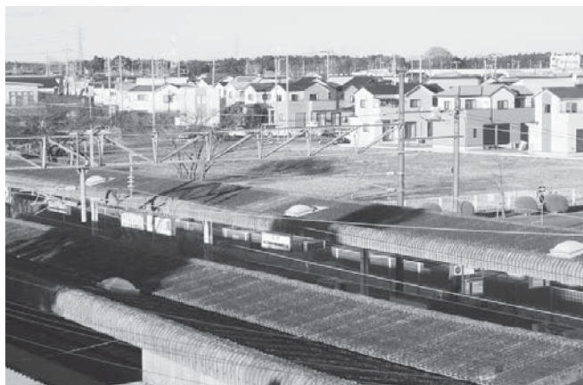
人口が増え続けている羽鳥駅東側

A 副市長 若い女性の人口流出を防ぐためには、本市の魅力向上を図りつつ、雇用や子育て環境の充実も重要なので、総合計画後期基本計画に基づき、人が集まり、活性化され、まちも人もうるおい、安心して暮らせるよう、しっかりと各種事業を進めていく。