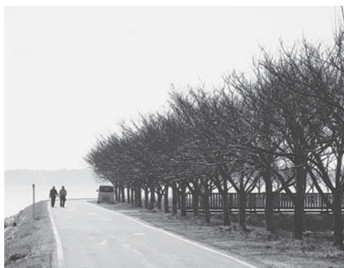
霞ヶ浦湖岸の桜並木

羽鳥駅の橋上化や霞ヶ浦湖岸の桜並木、更には空港と関連付けた霞ヶ浦の観光資源の有効活用、茨城空港の航路拡大、空のえきの利用促進など、3つのエリアで一つ一つ結果を出していきたい。