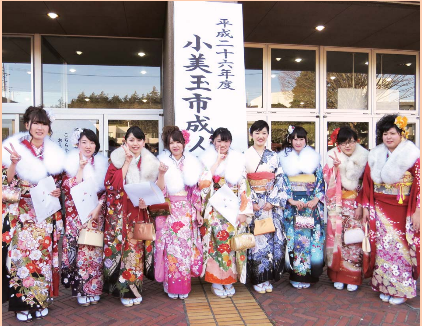
大人の仲間入り！小美玉市成人式