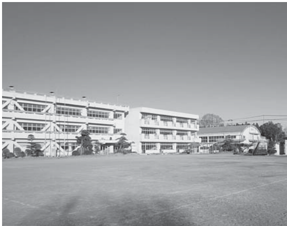
児童数が増え続けている羽鳥小学校

また結婚相談事業は、男女が出会い、結婚する機会づくりを提供することにより、ストップ少子化戦略としても有効性が高いと考えている。