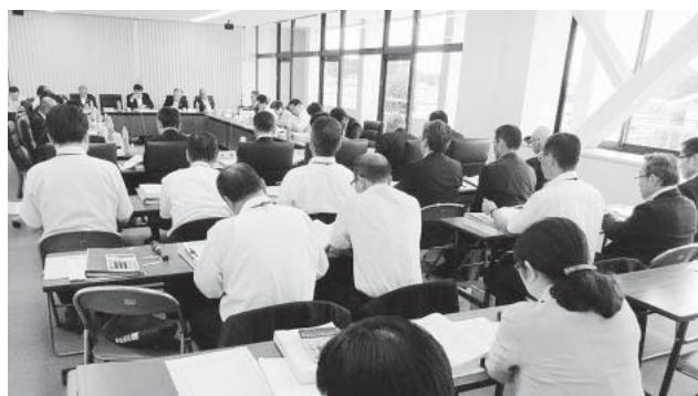
▲産業経済・都市建設の決算審査の様子