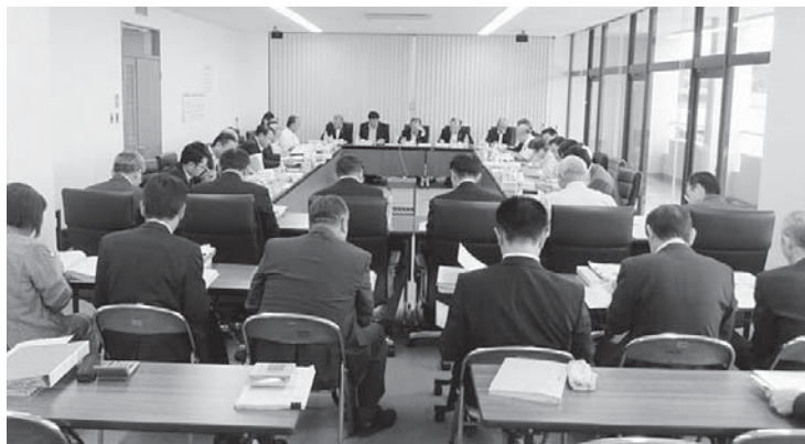
▲教育・福祉・医療の決算審査の様子

A. 市内の全小学校5年生を対象に開催し、子どもたちに夢を持つこと、努力することの大切さなどを伝えることができた。市民や子どもたちから好評を得ている。