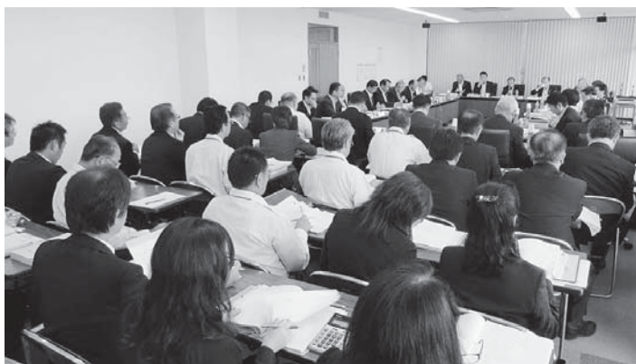
▲市政全般・市民生活・消防の決算審査の様子

A. 現在 1 名を配置しており、去年の実績では約 770 万円を徴収している。