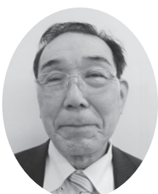
朝倉 実行 美野里地区