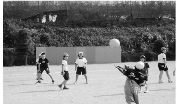
縦割り班での遊び