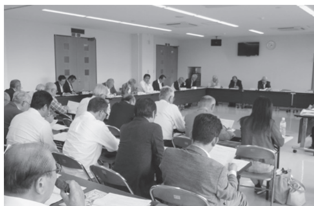
申請者による補助金申請事業説明