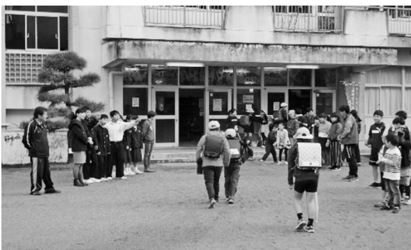
小中合同あいさつ運動