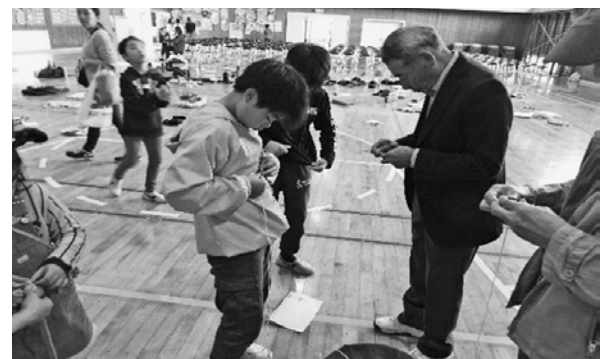
親子 3 世代交流玉北ハート集會