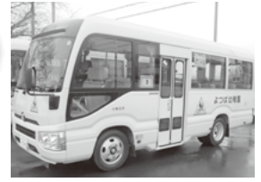
▲よつば幼稚園送迎バス