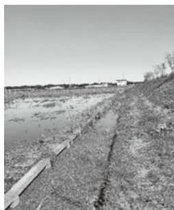
▶堤脚水路 (令和4年10月20日撮影)