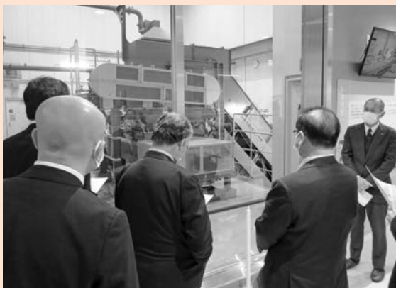
▲霞台厚生施設を視察

答 本年度は現在、墓地を返還した件数は6件、無縁仏は1か所ある。管理が行き届いていない墓地は、管理費を引き続きお願いしている。