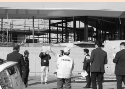
▲現地視察 幡谷地内（12月20日）