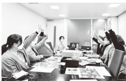
▲対話の文化を用いた企画会議の様子

Q 第8次医療計画に位置付ける「在宅医療において積極的役割を担う医療機関」及び「在宅医療に必要な連携を担う拠点」の選定に取り組みたい。在宅医療・介護連携の進め方について問う。 A 福祉部長 在宅医療に必要な連携を担う拠点に連携支援を行うコーディネートター等々の配置をはじめ、(仮称)在宅医療・介護連携推進協議会を設置することにより、多職種協働による連携強化を図りながら推進していく。 Q 令和6年度予算編成過程に外部施策評価の結果をどのように反映させるか、執行権者である市長に問う。 A 市長 外部評価を受けた所管課は事務事業の見直しと検証を行い実施計画に位置付ける。各課より提出された実施計画は総合計画の成果指標を達成するための事業であるか、施策に位置付けられた事業であるか、私の施策を実現する事業であるかなどの視点から、予算要求の条件となるダブル