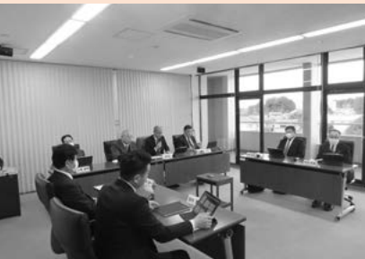
▲付託議案の審査（12月19日）

問 子ども達に貸与しているタブレットの修繕費は、今後が増えることが予想されるのかを伺う。 答 11月30日現在で、325台ほどのタブレットを修理している。令和4年度実績で216台なので、現時点で100台以上多いことから、修繕は増えてくると思われる。