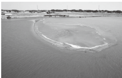
▲霞ヶ浦ウェットランド内に堆積した土砂

A 都市建設部長 園部川の玉里土地改良区の揚水ポンプ周辺に堆積した土砂撤去工事は年明け1月頃に水戸土木事務所が行う予定。霞ヶ浦に堆積した土砂撤去は今年度国の補正予算が決まり新年度に工事を実施する予定である。