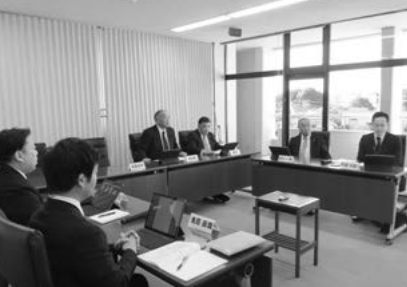
▲付託議案の審査（12月18日）

答 郵便料については1件につき約104円の郵便料、荷造運搬料については1件約1,000円を見込んでいます。手数料はポータルサイト利用料等であり、寄附額の約10%がかかる。