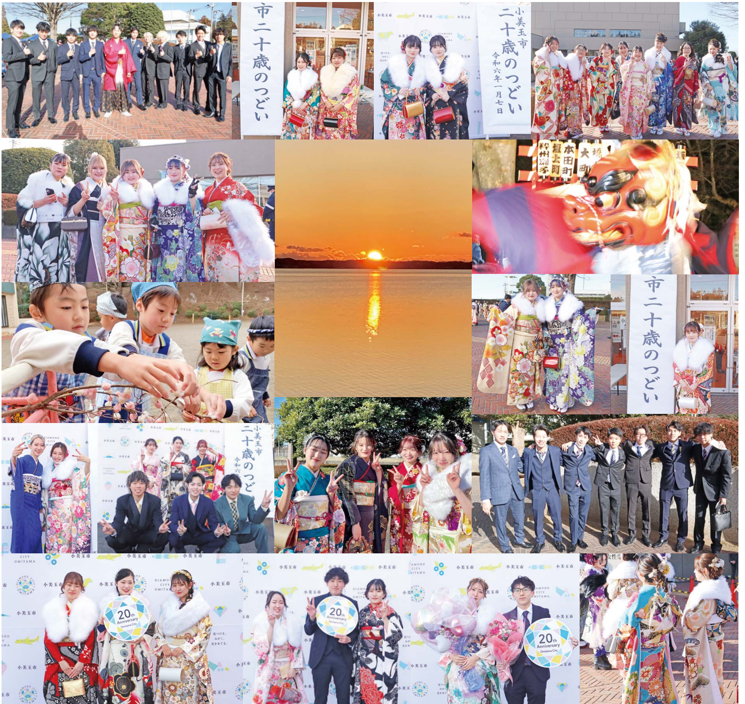
◆ 2024年 小美玉新年写真集 小美玉市二十歳のつどい・ならせ餅・元旦素鷲神社境内獅子舞・大井戸湖岸公園から望む初日の出