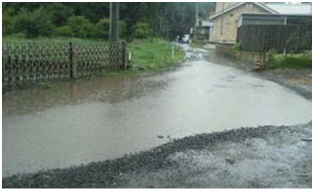
平成29年8月15日11時 撮影