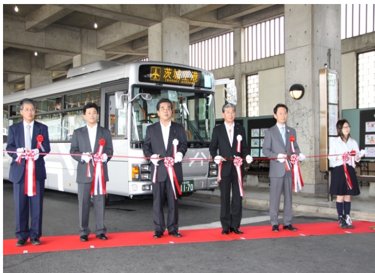
▲ テープカットの様子

式典終了後は、関係者による『かしてつバス』の試乗会が開催され、石岡駅から茨城空港まで乗車し、全国初となるバス専用道のメリットのひとつである『渋滞無縁!』を体験しました。