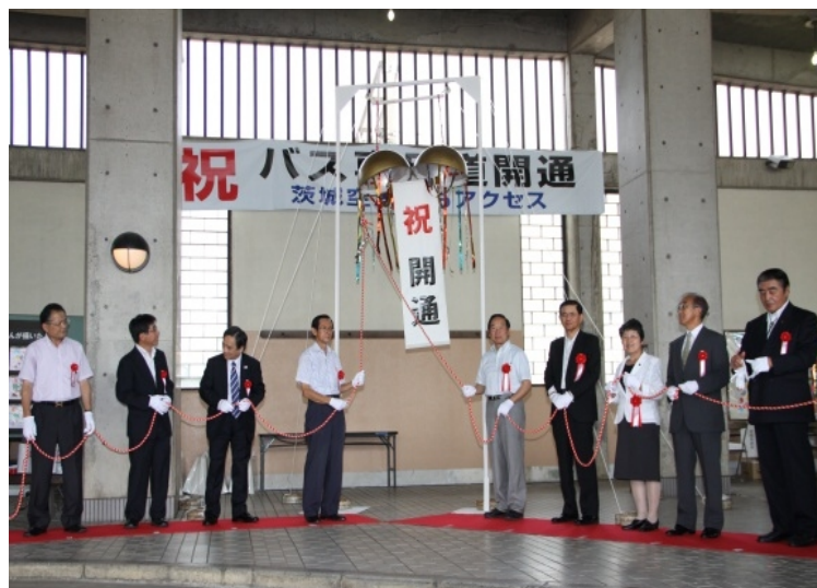
▲ くすだま開扉の様子