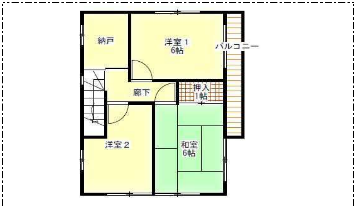
【 2階 】