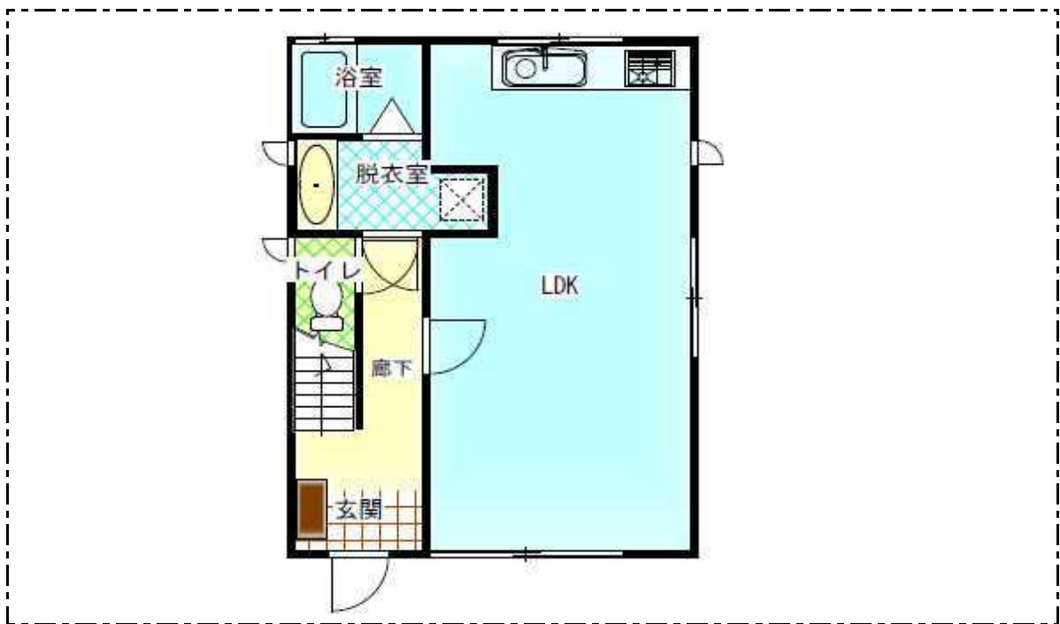
【 1階 】