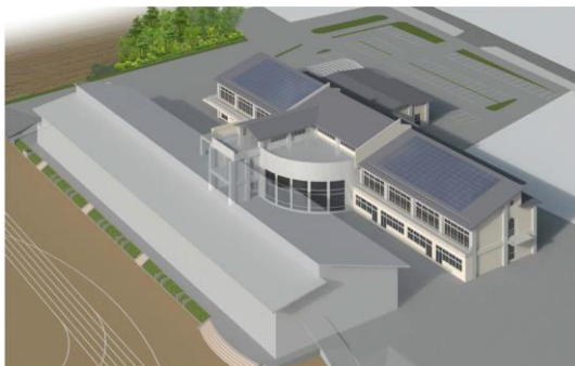
鳥瞰図：南東より校舎をみる