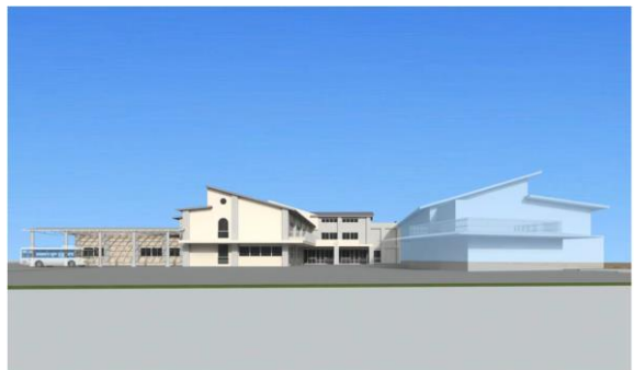
外観透視図：西側より昇降口をみる