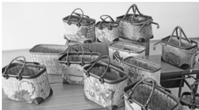
一閑張の手さげかご

美野里地区の5つの公民館で実施した市民講座の作品を展示します。受講生の精魂込めた力作をご覧ください。