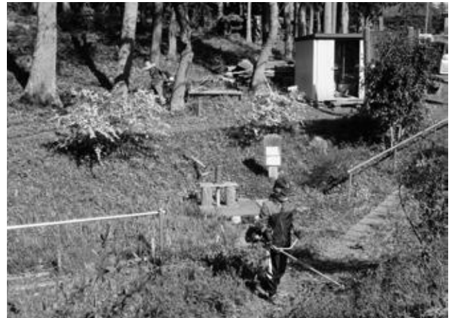
中台東「ホトメの里」の会「環境整備事業」

市民主体のまちづくりのさらなる推進のため、市が認定するまちづくり組織に対して、活動費補助等の支援をしております。