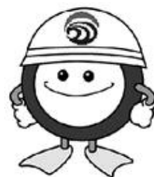
下水道マスコットキャラクター「スイスイ」

生活排水による公共用水域の水質汚濁防止のため、高度処理浄化槽を設置する方を対象に、設置費用の一部を補助しています。現在、より多くの方々が活用できるように、補助制度の見直しを図っています。内容が決まり次第、広報紙・ホームページでお知らせします。