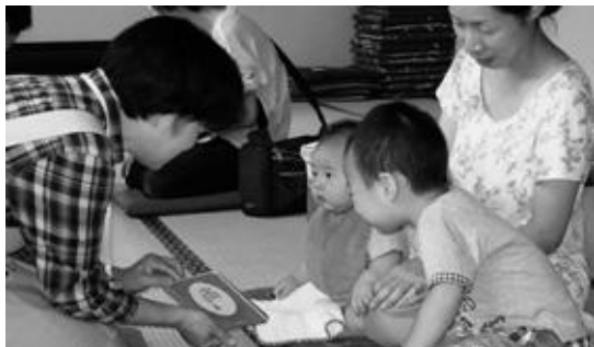
絵本の読み聞かせ (2016年)

ブックスタートは、親子・子育てを応援する人・自治体が「赤ちゃんの幸せ」という共通の願いで行う取り組みです。