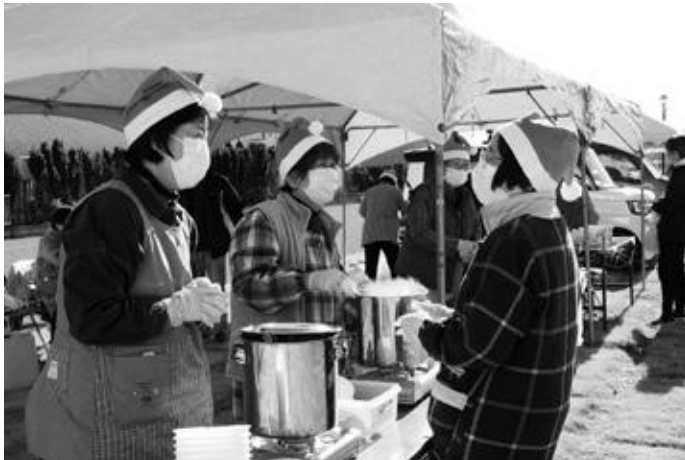
こころふれあう羽鳥の会「はとりクリスマスフェス」