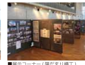
■展示コーナー(陽だまり横丁)