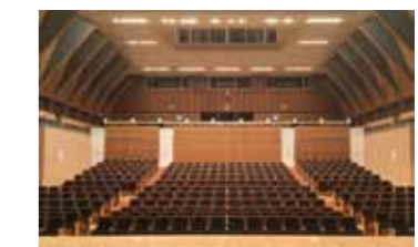
■パネルにより客席を仕切る(322席)