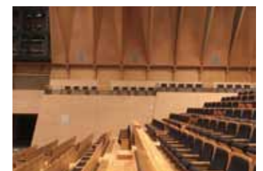
■森をイメージした内装