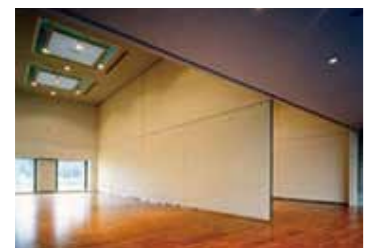
■可動パネルによる分割