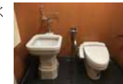
■オストメイト用汚物流し(左)