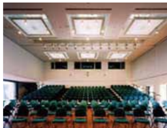
■客席設営例(後方がロールバックチェア)