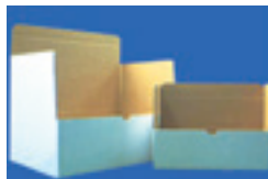
B式段ボールケース