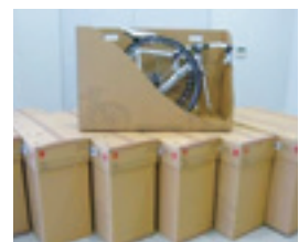
BTB(自転車輸行用段ボール)