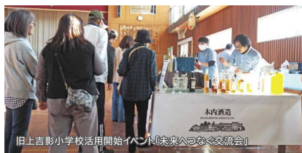
旧上吉影小学校活用開始イベント「未来へつなぐ交流会」