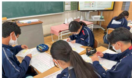
未来年表を作成する美野里中学校の2年生