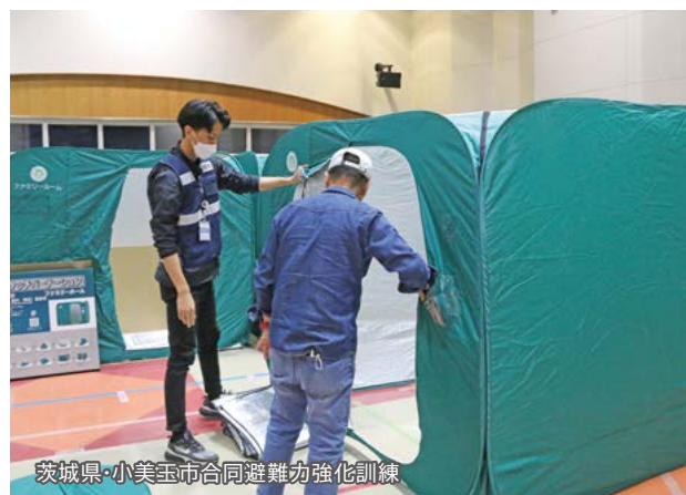
茨城県・小美玉市合同避難力強化訓練