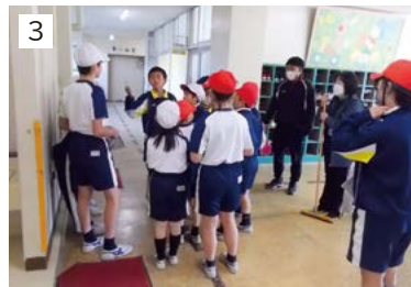
1 田植え 2 納場っ子サポーターとの授業 3 縦割り班活動