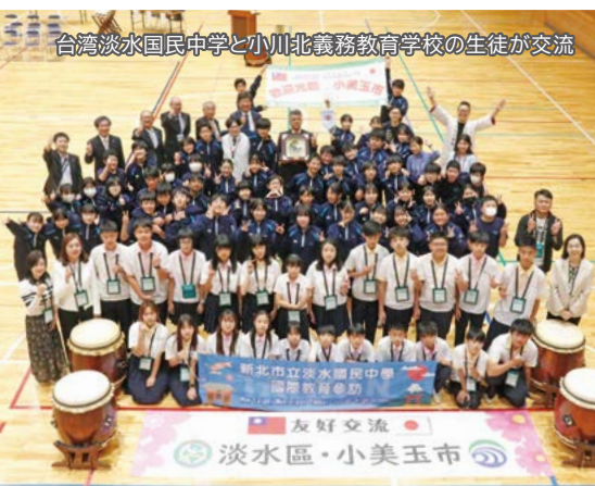
台湾淡水国民中学と小川北義務教育学校の生徒が交流

また、ALTの積極的な配置や海外とのオンライン交流により、外国語教育の充実を図るほか、台湾やアビリン市との交流を通じ、子どもたち同士による意見交換や異文化体験の機会を創出し、グローバルな視点を身につけられる