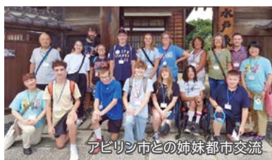
アビリン市との姉妹都市交流