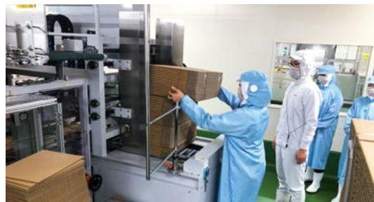
(株)ダイショーで梱包工程のケースセット体験

問 商工観光課 商工企業誘致係 ☎ 0299-48-1111 (内線 1162)