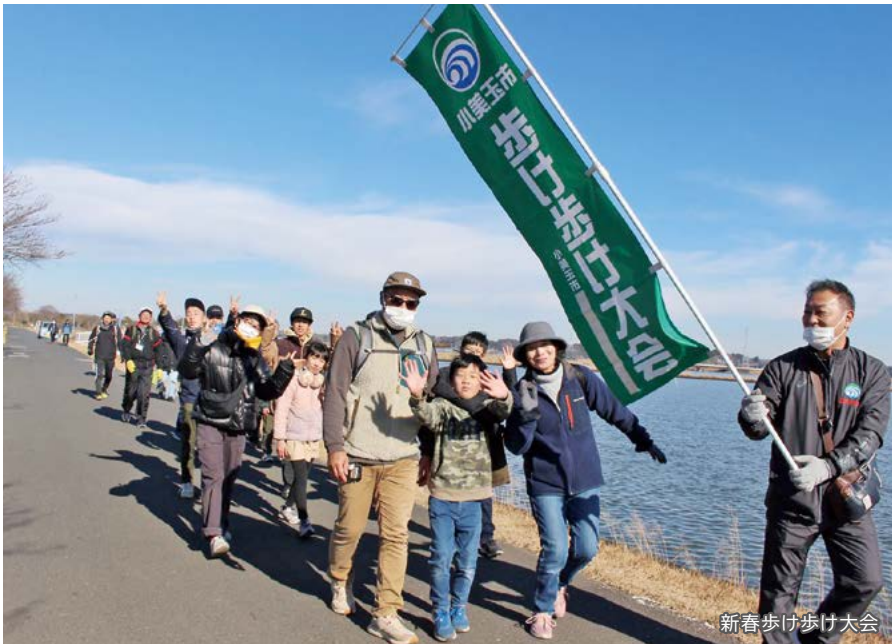
新春歩け歩け大会