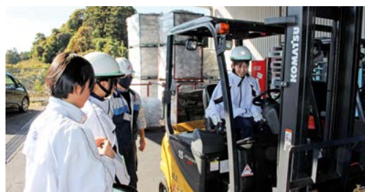
十和運送(株)でフォークリフト体験