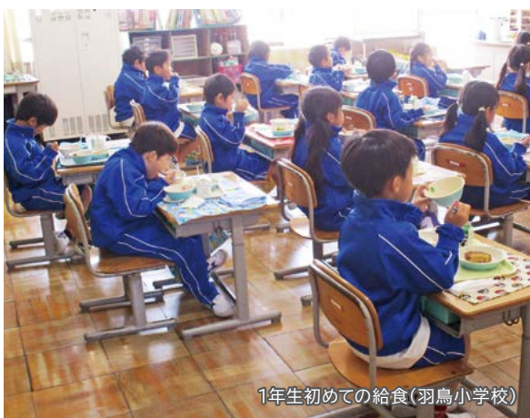
1年生初めての給食(羽鳥小学校)

環境づくりを推進しております。 今後とも、子どもたちの教育環境の向上と、新たな学びの創出に努めてまいります。