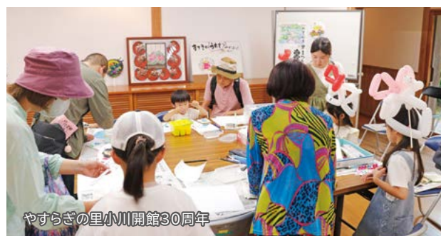
やすらぎの里小川開館30周年