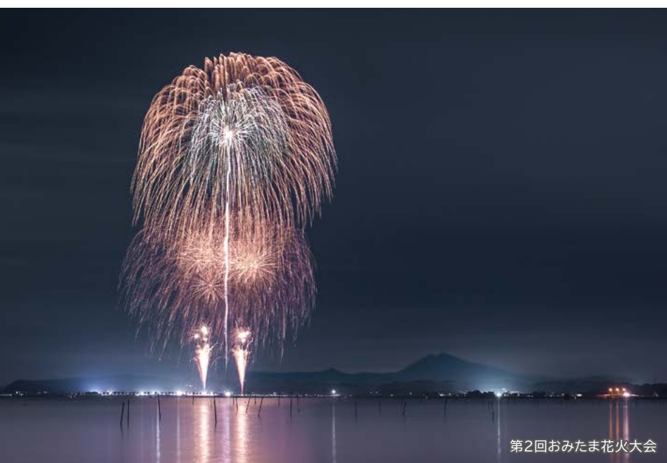
第2回おみたま花火大会