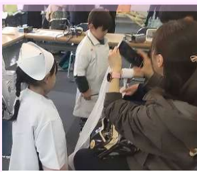
茨城県さぬ看護専門学校 様