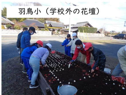
羽鳥小（学校外の花壇）