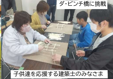
ダ・ビンチ橋に挑戦