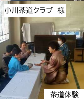
小川茶道クラブ 様