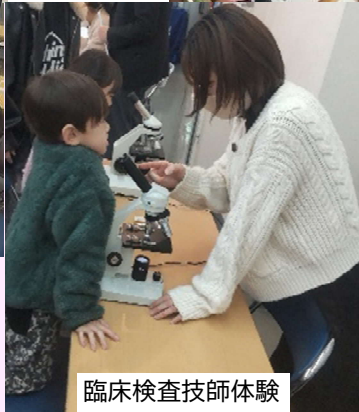
臨床検査技師体験