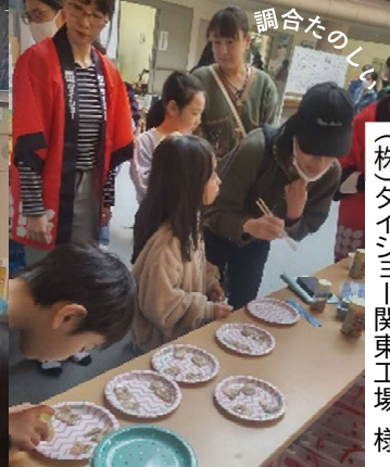
調味料づくり・お肉の試食