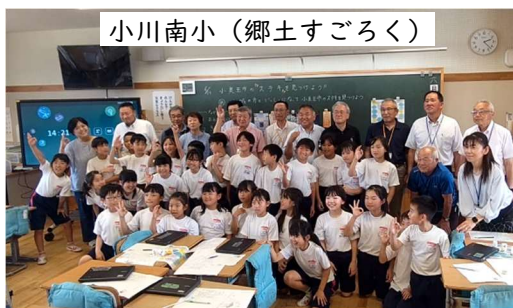
小川南小（郷土すごろく）