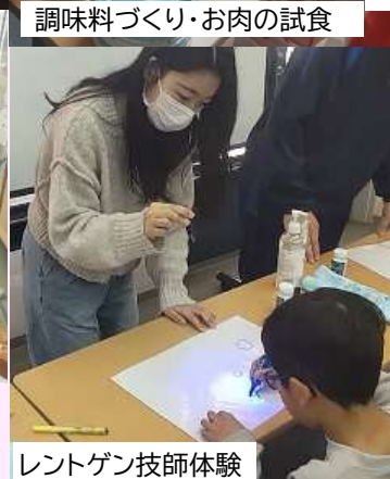
レントゲン技師体験