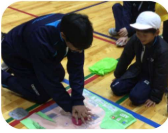
縦割り班（1～9年生）をいかした 防災フェスティバル