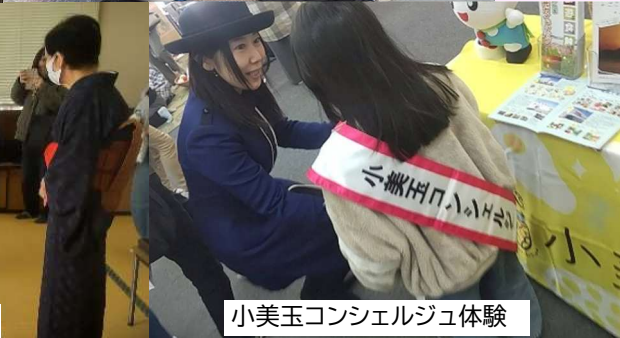
小美玉コンシェルジュ体験