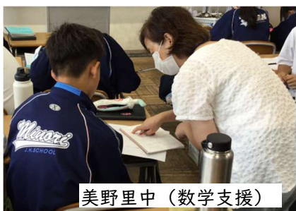
美野里中（数学支援）