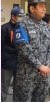
自衛隊茨城地方協力本部 百里分駐所 様