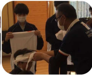
子ども・保護者・地域が一体となった 防災フェスティバル