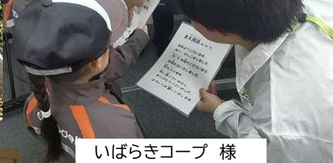
いばらきコープ 様