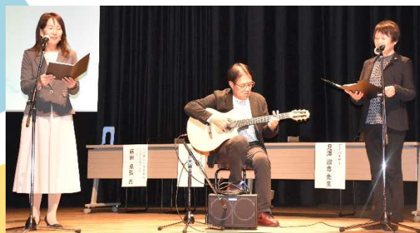
▲最後にギター演奏と「糸」の朗読

年度当初に小美玉のコーディネーター対象の研修講師を務めさせていただきましたが、その時にも感じたのが、学び合う姿勢と、地域を愛する心でした。今回のフォーラムでもそれらが溢れていました。 もう一つ感じたのは、地域の人たちが楽しみながら実践しているということです。「すごいことをやってる!!」とっていないところがさらに素晴らしいです。