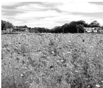
旧コスモス畑（希望ヶ丘公園周辺）

希望ヶ丘公園周辺のコスモス畑の事業終了に伴い、農地保全を行うとともに、造成跡地の利活用に向けた調査を実施するもの。調査では跡地利活用計画案の作成などが行われます。