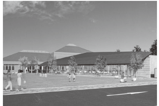
生涯学習交流施設（イメージ）

◎急傾斜地整備工事のスケジュールは。 ▲旧小川小学校の法面を令和8～9年度に、神社側の法面を令和10年度に整備する予定。 ◎生涯学習交流施設整備工事の工程は。 ▲生涯学習交流施設建築工事及び小川図書館・資料館改修工事、外構工事を令和8年度に着工し、令和9年度中の供用開始を予定している。