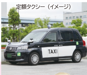
定額タクシー（イメージ）

高齢者の外出機会の創出と移動円滑化のため、タクシーを利用して外出する際の運賃を一部助成します。令和7年度の実証運行で出た改善点を踏まえ、よりよいサービスに向け、継続運行します。