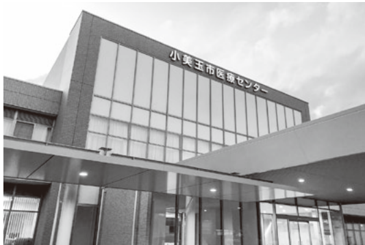
経営改革を進めながら地域医療の維持に取り組む小美玉市医療センター

◎この交付金も残り4年4回。市として4年後以降の交付金終了後についての考えを伺う。 ▲医療センターは、市民からの評価も高く、医業収益も増加している。一方、赤字幅は縮小しているものの赤字体質は続いている。しかし、地域医療の維持という点では存在意義はますます大きなものになると捉えている。収支の経過を注視し、地域医療存続の方向性を検討していく。