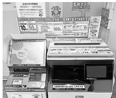
マルチコピー機（市役所内）

コンビニや市の庁舎に設置されているマルチコピー機でマイナンバーカードを利用した各証明書発行手数料を300円から100円に減額します。