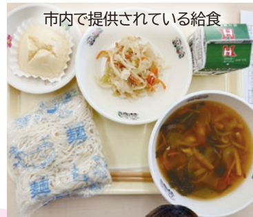
市内で提供されている給食

市内在住の園児が通う幼稚園の給食費を無償化し、保育園で提供される給食費を一部助成します。保育園の助成額は幼稚園給食費無償化相当額の3,400円/月。市外の保育園に通う市内園児も対象となります。