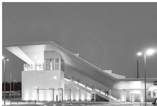
新たな交流拠点整備が羽鳥駅周辺で検討される

◎建設物価が高騰しているが、事業トータルコスト及び今後の工程をどのように見込んでいるか伺う。 ▲当調査は、事業パートナーとなる複数の民間企業と意見交換し、これらの各条件を組み合わせるなど、当地に合った事業形態を検証するもの。ご指摘の市場性を加味することは当調査の一つでもあり、工程などは当調査により検証していく。