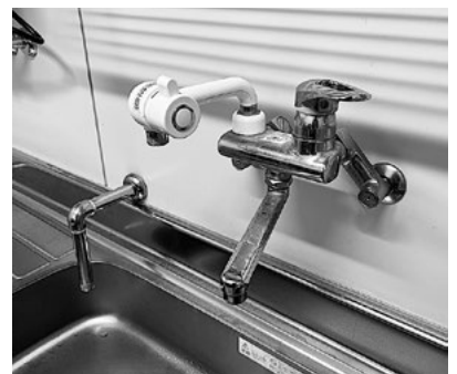
上水道料金が減免

物価高騰に対する経済的支援として、令和8年4月から令和9年3月請求分の水道料金の一部を減免します。減免額は1,210円/月です。