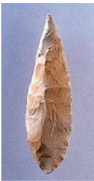
尖頭器 (権現平遺跡出土)

狩猟や採集活動のための道具には、石を打ち欠いて作られた打製石器や動物の骨や角を用いて作られた骨角器などがあります。狩猟具は、その形から尖頭器、ナイフ形石器、台形様石器と呼ばれており、槍の先端につけていました。そのほか、穴をあけるための石錐、皮なめしに使う搔器、木の実をすりつぶすための磨石などがあります。