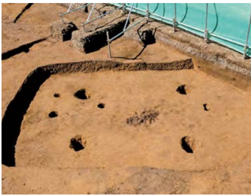
第9号竪穴建物跡(左側が南)

この時期の集落は、住居3～5軒ぐらいで、一つのグループを構成していました。台地は、調査区の北側、南側に広がっているため、当遺跡においても何軒かの住居があり、集落を構成していたと思われます。