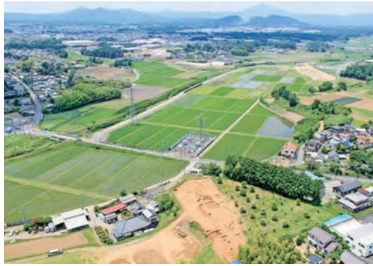
並木新田台北遺跡 調査区遠景(東から)

並木新田台北遺跡は、竹原坂下農村集落センター西側の小美玉市大谷字並木新田台に所在し、園部川左岸の標高20～25mの台地縁辺部に立地しています。