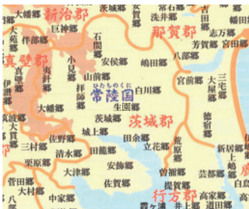
常陸国茨城郡の郷名(茨城県立歴史館「よみがえる古代の茨城」図録より)

行政機構として、国の管下には評と五十戸(里)が編成され、地方の村々まで支配が及びました。この制度は大宝元年(701年)の大宝律令などの律令制整備に伴い、