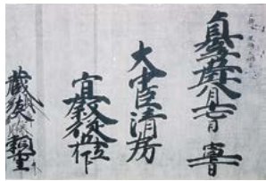
▶ 東山天皇口宣案(個人蔵)