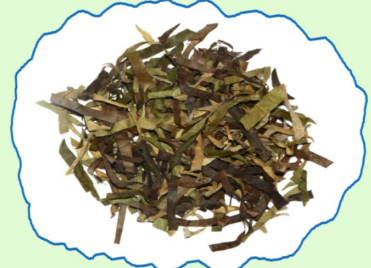
とげ抜きの家伝薬 個人蔵

小川図書館・資料館では、小川にむかしから伝わる「かっぱの伝説」の展示やイベントがもりだくさん! この夏は、みんなでかっぱに会いにいこう!