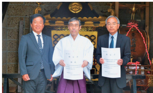
(左から)羽鳥教育長、素鷲神社 木名瀬宮司、藤井総代長