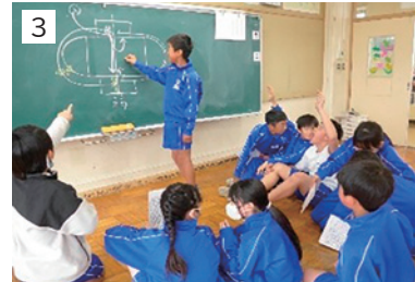
1 羽鳥っ子ソーラン(運動会当日) 2 大玉運び(運動会当日) 3 運動会の話し合い