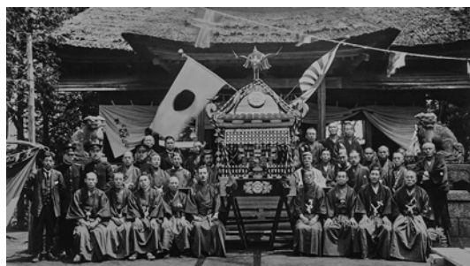
おみこしせんぐうしき 御神輿遷宮式(大正15年)